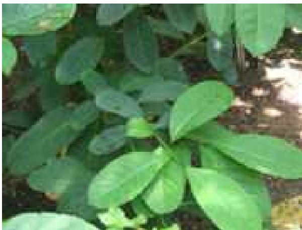
Dalle foglie della pianta si ricava il mate.